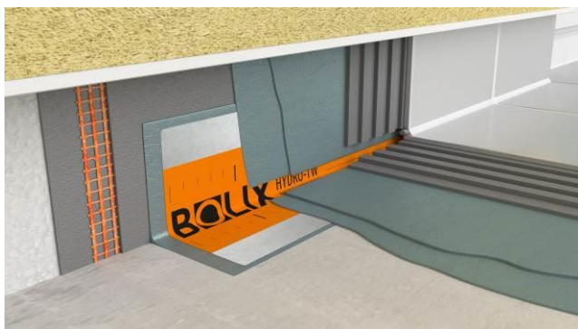
Połączenie ściany z posadzką

BOLIX S.A. gwarantuje właściwą jakość wyrobu, lecz nie ma wpływu na rodzaj jego zastosowania i sposób użycia. BOLIX nie ponosi odpowiedzialności za pracę Projektanta i Wykonawcy. Wszystkie przedstawione wyżej informacje zostały podane w dobrej wierze według najnowszego stanu wiedzy i techniki stosowania. Nie zastępują one fachowego przygotowania Projektanta i Wykonawcy oraz nie zwalniają go z przestrzegania zasad sztuki budowlanej i BHP. W przypadku wątpliwości należy przeprowadzić odpowiednie próby lub skontaktować się z Działem Technicznej Obsługi Klienta BOLIX. Wraz z wydaniem powyższej Karty Technicznej wszystkie poprzednie tracą swoją ważność.